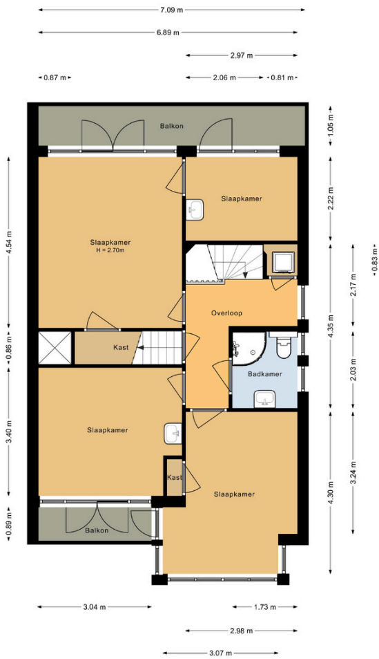
Eerste verdieping Heemsteedse Dreef 144 Heemstede